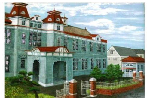
旧校舎 小山種三郎氏画 昭和14年(第52回) 卒